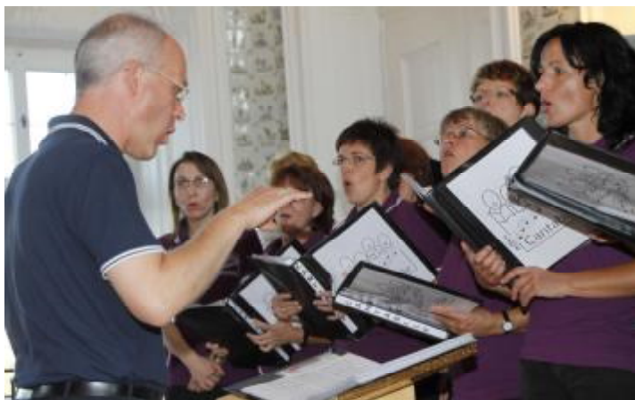
Schlosskonzert mit dem stimmungswaltigen Chorensemble „Cantabile“ aus Beilngries und Teilnehmer des Konzerts