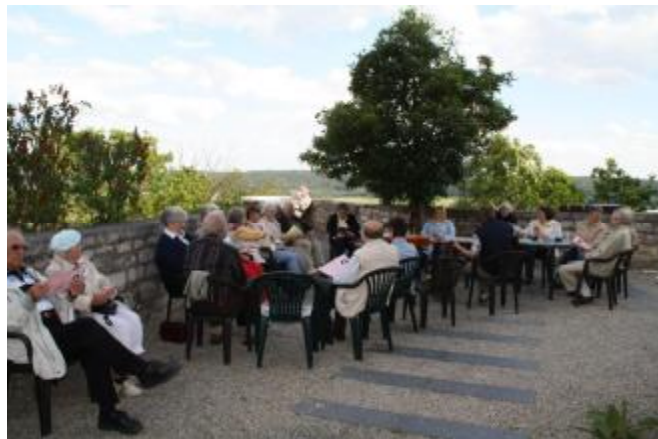
Teilnehmer singen im Rosengarten von Schloss Hirschberg