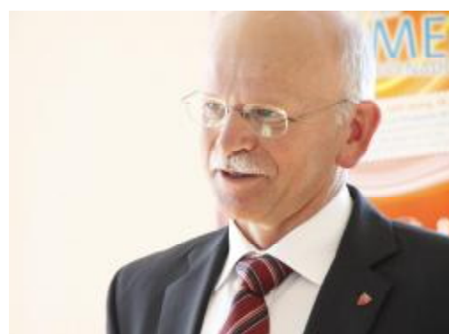
Anton Grad, Bürgermeister von Beilngries