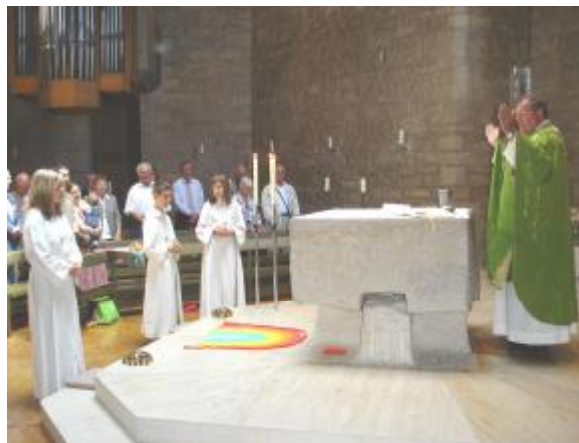
Familien- und Abschlussgottesdienst