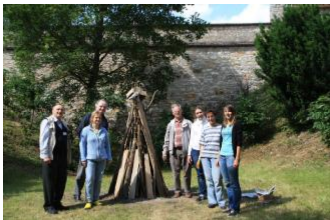
Das Hirschberg Feuer wird im Burggraben aufgebaut