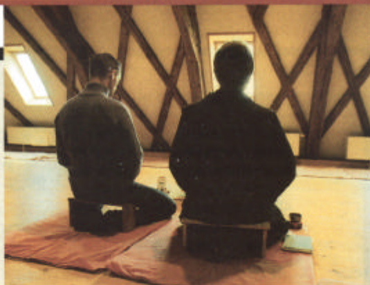
Beten und meditieren: 500 Klöster in Europa laden auch Konfessionslose zur stillen Einkehr